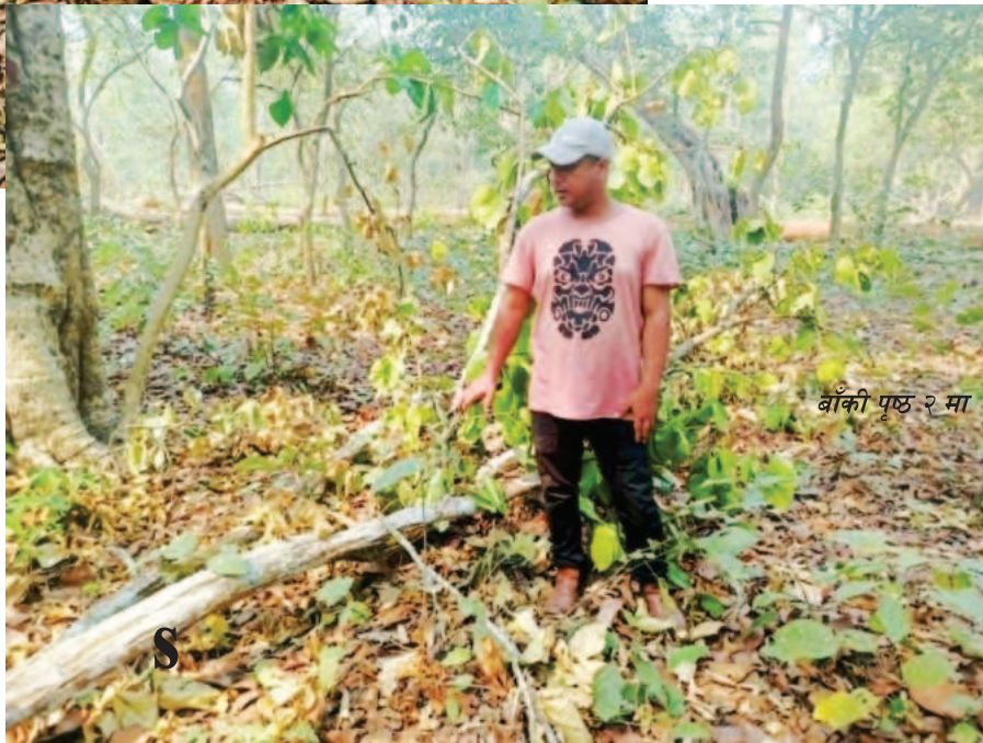
बाँकी पृष्ठ २ मा

वन केवल काठ उत्पादन गर्ने स्रोत मात्र होइन, वातावरणीय सन्तुलनको आधार पनि हो। वनले जलस्रोत संरक्षण, तापक्रम नियन्त्रण, जैविक विविधताको संरक्षण तथा प्राकृतिक विपद् न्यूनीकरणमा महत्वपूर्ण भूमिका खेल्छ। तर संरक्षण गर्नुपर्ने निकायकै संरक्षणमा वन विनाश भइरहेको आरोपले राज्य संयन्त्रमाथि गम्भीर प्रश्न खडा गरेको छ। स्थानीयवासी तथा वातावरण संरक्षणकर्मीहरूले तत्काल उच्चस्तरीय छानबिन गरी अवैध कटानी रोक्न,