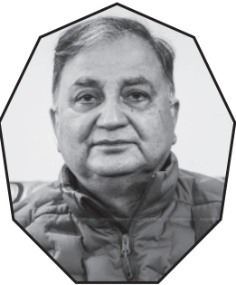
— ईश्वर पोखरेल

मैले २०३५ साल असारको अन्तिम दिन पहिलोपटक मदन भण्डारीलाई भेटेको थिएँ। तर, २०५० साल जेठ १ गते बिहान साढे आठ बजेपछि उहाँसित कहिल्यै भेट हुन सकेन। उहाँ कहिल्यै भेट नहुने गरी हामीलाई सधैंका लागि छोडेर जानुभयो। २०५० साल जेठ ३ गतेको षडयन्त्रपूर्ण दुर्घटनामा परी उहाँ आफ्ना घनिष्ठ सहयोगी जीवनराज आश्रितसहित भौतिक रूपले नै हामी सबैबाट सदाका लागि बिदा हुनुभएको थियो।