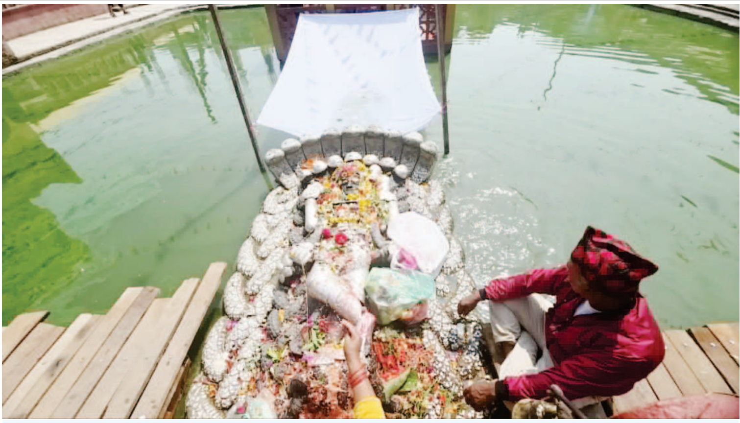
मत्स्यनारायणको पूजाअर्चना गर्दै भक्तजन: भक्तपुर नगरपालिका-६ स्थित अंचा पोखरी (ख्यो पुखु) मा आइतबारदेखि सुरु भएको एकमहिने मत्स्यनारायण अर्थात् पुरुषोत्तम अधिकमास एवम् मलमास मेला मत्स्यनारायणको पूजाअर्चना गर्दै भक्तजन ।

उनले न्यायपालिका र संविधान पुनर्संरचनाजस्ता संवेदनशील विषयमा व्यापक राजनीतिक सहमति आवश्यक भए पनि त्यसतर्फ सरकार गम्भीर नदेखिएको बताए । बार अध्यक्ष मिश्रले न्यायाधीश नियुक्तिमा कायम रहेको गोला प्रणाली हटाउन नदिने स्पष्ट पाउँदै न्यायपालिकालाई राजनीतिक प्रभावबाट मुक्त गर्नु आवश्यक रहेको बताए । उनका अनुसार विगतका सरकारको समयमा जस्तै अहिले पनि न्यायपालिका पूर्ण रूपमा राजनीतिक प्रभावबाट मुक्त हुन नसकेको अवस्था रहेको छ । कार्यक्रममा बारका पदाधिकारी, कानून व्यवसायी तथा अधिवक्ताहरूले संविधान संशोधन, न्यायपालिका सुधार र संघीय संरचनाका विषयमा धारणा राखेका थिए ।