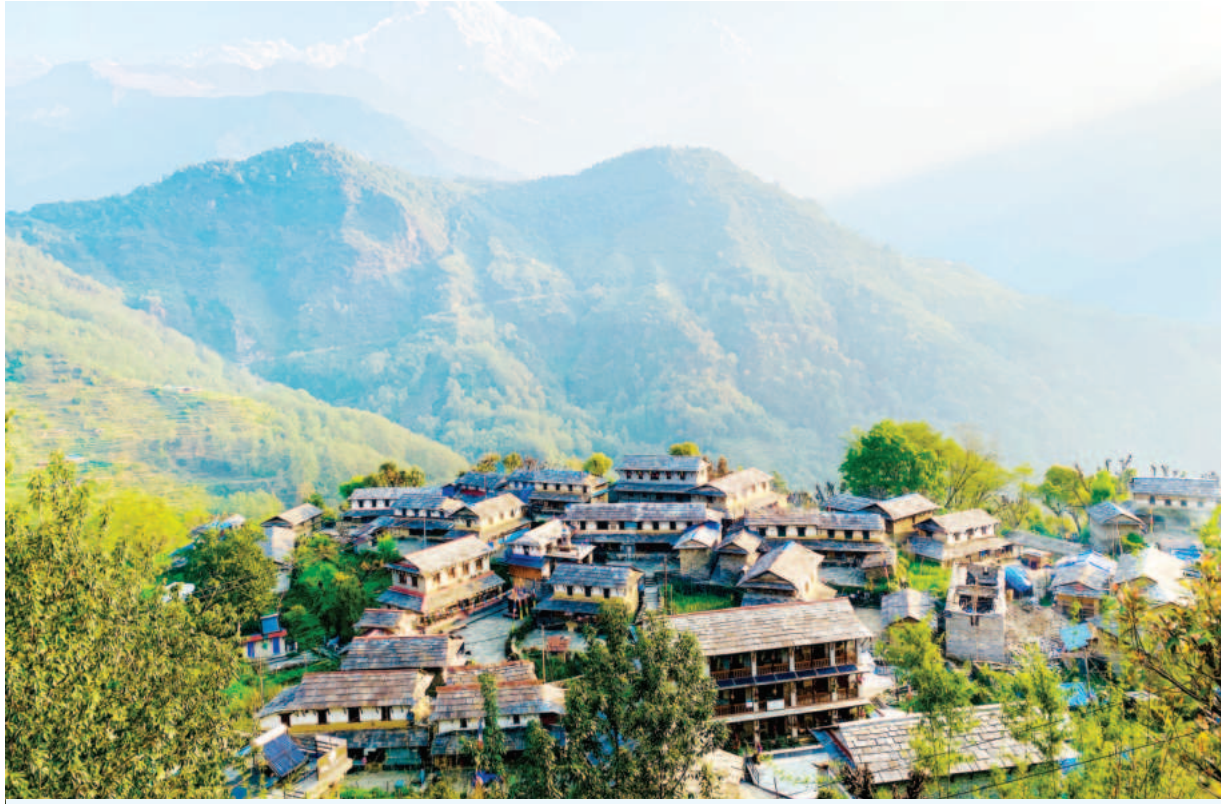
घमाइलो घान्द्रुक: कास्कीको अन्नपूर्ण गाउँपालिका-११ स्थित घान्द्रुक डाँडागाउँ । अन्नपूर्ण चक्रीय पदमार्गमा पर्ने घान्द्रुक नेपालकै चर्चित पर्यटकीय गन्तव्यस्थल हो ।