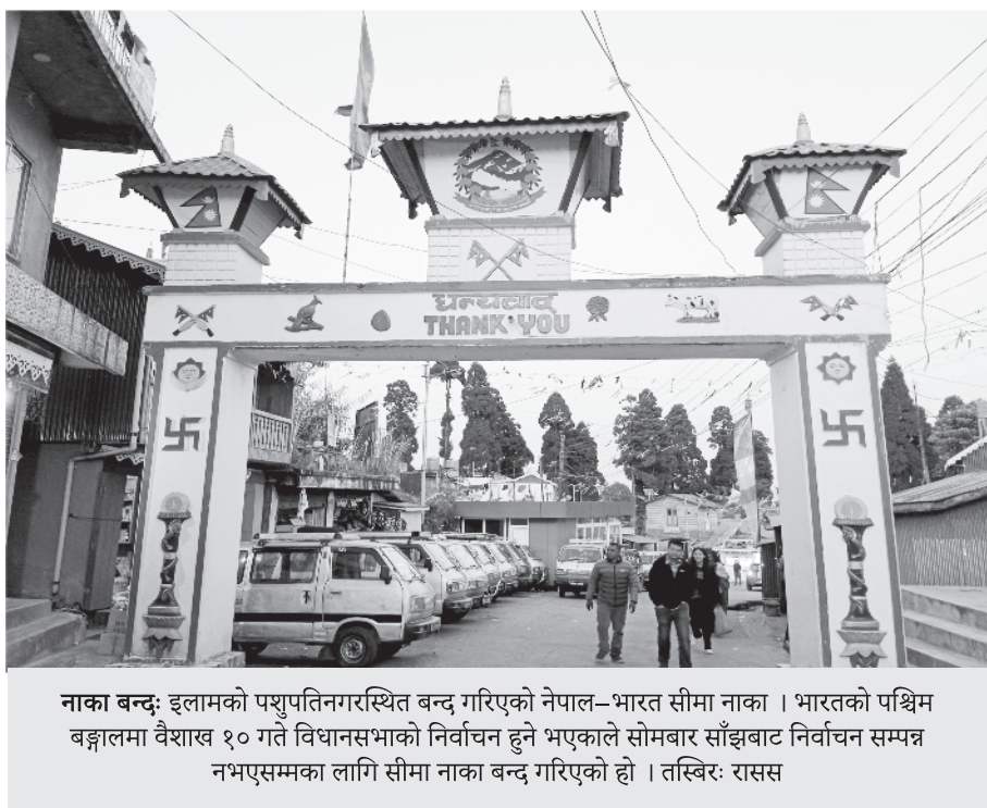
नाका बन्द: इलामको पशुपतिनगरस्थित बन्द गरिएको नेपाल-भारत सीमा नाका । भारतको पश्चिम बङ्गालमा वैशाख १० गते विधानसभाको निर्वाचन हुने भएकाले सोमबार साँझबाट निर्वाचन सम्पन्न नभएसम्मका लागि सीमा नाका बन्द गरिएको हो ।