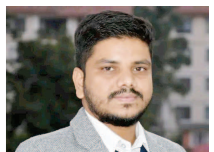
रामजी यादव श्रममन्त्री

विसं. २०७९ वैशाखमा भएको स्थानीय तह निर्वाचनमा शाहले ९० हजार ८ सय ३५ मत ल्याएर चुनाव जित्ने दावी गरेका थिए। शाह २०७९ मा खसेको मतको ३८.६% मत प्राप्त गरी निर्वाचित भए। अहिले उनी प्रधानमन्त्रीका रूपका कार्यरत मात्रै छैनन्, संविधान संशोधनको मुद्दालाई निष्कर्षमा पुर्याउनु पर्ने, मध्यपूर्व तनावले देशमा बढेको अनेक संकट परा लगाउनु पर्ने चुनौतीमा डटिरहेका छन्। सुशासन कार्यान्वयन, पुराना नेताहरुको सम्पति छानबिन र युवा पुस्तालाई देशमा सम्भावना देखाउने उनको प्रमुख कार्यभार हो।