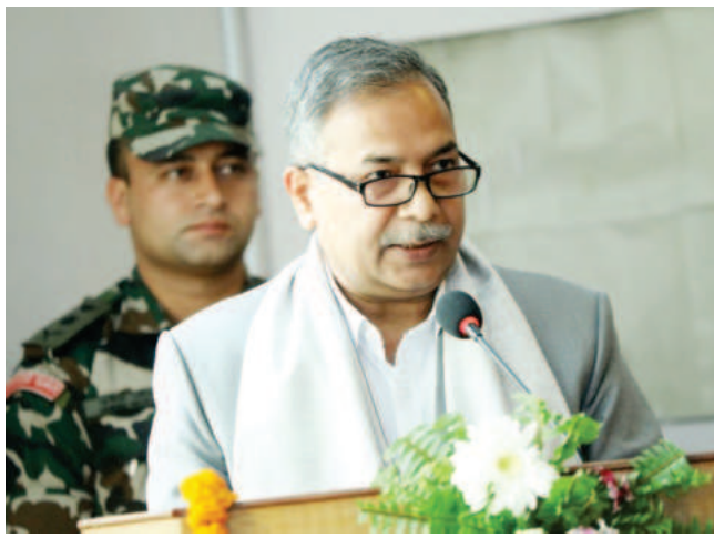
रामसाहायप्रसाद यादव उपराष्ट्रपति

यो असन्तुष्टि जस्तै अरु पनि दुःख पो थपिने हो कि ? जनता त्रसित र सशंकित छन्। फेरि पनि सरकार बलशाली छ। बालेन्द्र शाहले गलत गद्दैन भन्ने भरोसा र आसा पनि छ।