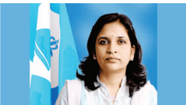
गौरी कुमारी यादव उद्योगमन्त्री

२०७६ मा समाजवादी पार्टी र राष्ट्रिय जनता पार्टी (राजपा) बीच एकीकरण भई गठित जनता समाजवादी पार्टी नेपालको कार्यकारी समिति सदस्य भए। विसं २०६४ को पहिलो संविधान सभामा संविधान सभा सदस्य भएका उनी २०७४ र २०७९ को प्रतिनिधिसभामा बारा क्षेत्र नं. २ बाट निर्वाचित भए। पछि जनता समाजवादी पार्टी नेपालको संसदीय दलको नेतामा चयन भए। २०७६ मा वन तथा वातावरण मन्त्री भए। २०७९ चैत ३ गते उपराष्ट्रपतिमा विजयी भए। २०७९ चैत ६ गते उपराष्ट्रपतिको रूपमा पद तथा गोपनीयताको शपथग्रहण गरे।