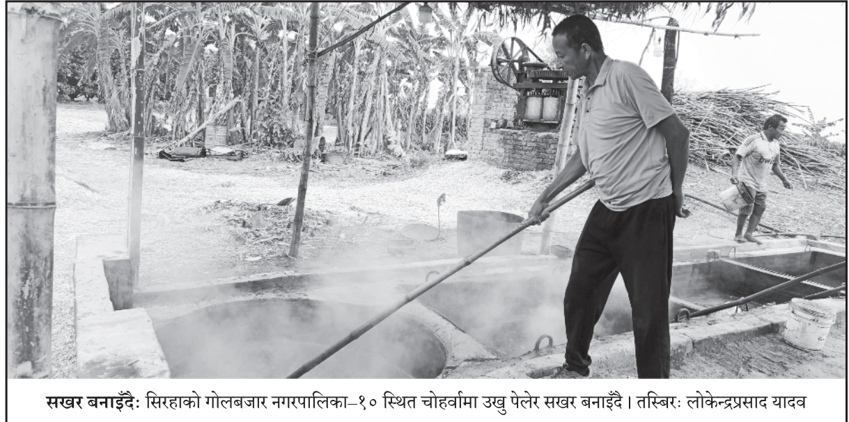
सखर बनाइँदै: सिरहाको गोलबजार नगरपालिका-१० स्थित चोहर्वामा उखु पेलेर सखर बनाइँदै ।

समस्या, नीतिगत अस्पष्टता, कर प्रणाली, पूर्वाधार अभाव लगायतका विषयहरू पनि उठाइएको थियो । ती सुझावहरूलाई गम्भीरतापूर्वक लिँदै सम्बन्धित निकायसँग समन्वय गरेर कार्यान्वयनमा लैजाने प्रतिबद्धता जनाइएको छ । 'यहाँहरूले उठाउनु भएका मुद्दा र सुझावहरू केवल सुन्ने मात्र होइन, कार्यान्वयन गर्ने दिशामा हामी निरन्तर लागि रहेनेछौं,' उनले स्पष्ट पारे । यस्तो प्रकारको संवाद र सम्मान कार्यक्रमले सार्वजनिक तथा निजी क्षेत्रबीचको सम्बन्धलाई थप मजबुत बनाउने अपेक्षा गरिएको छ । विशेषगरी पर्सा जस्तो औद्योगिक सम्भावना बोकेको जिल्लामा नीति निर्माता र उद्यमीबीचको सहकार्यले दीर्घकालीन आर्थिक विकासमा महत्वपूर्ण योगदान पुऱ्याउन सक्छ । कार्यक्रमले प्रतिनिधि र निजी क्षेत्रबीच विश्वासको वातावरण निर्माण गर्दै विकासका साझा एजेण्डा तय गर्ने दिशामा सकारात्मक सन्देश दिएको सहभागीहरूको भनाइ छ । साथै, आगामी दिनहरूमा निरन्तर सहकार्य, सुझाव र मार्गदर्शनको अपेक्षा समेत व्यक्त गरिएको छ ।