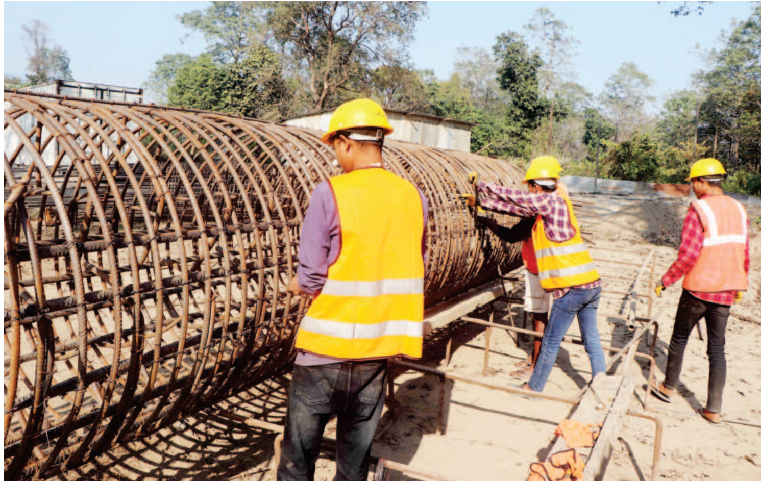
नारायणीमा पुल निर्माण हुँदै: नारायणगढ-गैंडाकोट जोडने नारायणी नदीमाथि निर्माणधीन आइकोनिक केबल-स्टेड पुलको फाउन्डेसन तयारीका क्रममा साइट क्याम्पमा स्टिल केज तथा छड बाँध्न काम गर्दै मजदुर ।