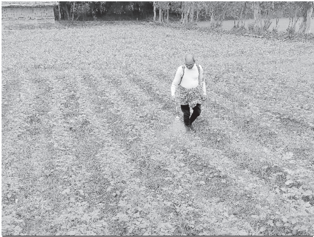
आलु बालीमा कीटनाशक औषधि: महोत्तरीको जलेश्वर नगरपालिका वडा नं ७ बेला गाउँका किसान आलु बालीमा कीटनाशक औषधि छर्किँदै ।