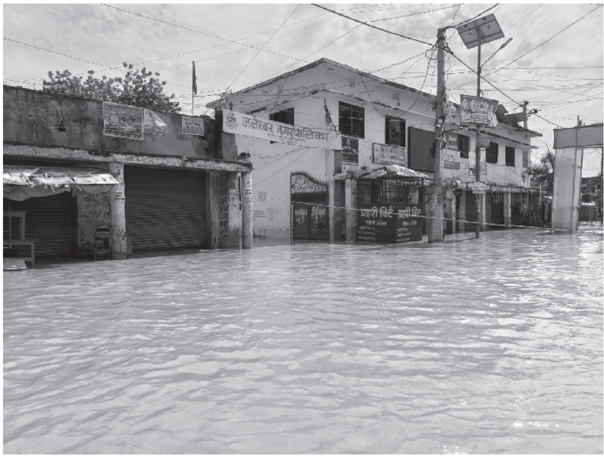
जलमग्न जलेश्वर: महोत्तरी सदरमुकाम जलेश्वर नगरपालिका-१ मा व्यवस्थित ढलको निकास नभएका कारण आइतबार र सोमबार परेको पानीले जलमग्न भएको जलेश्वर नगरपालिका कार्यालय ।