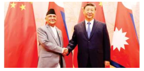
चीन । प्रधानमन्त्री केपी शर्मा ओली र चीनका राष्ट्रपति सी चिनफिङबीच दुई पक्षीय भेटवार्ता भएको छ । शाङ्हाइ सहयोग सङ्गठन (एससिओ) को शिखर सम्मेलनमा सहभागी हुने सिलसिलामा शनिबार अपराह्न चीन पुगेका प्रधानमन्त्री ओलीले राष्ट्रपति सीसँग थियानजिन अतिथिगृहमा भेटवार्ता गरेका हुन् । त्यसअघि उनले प्रधानमन्त्री ओलीलाई स्वागत गरेका थिए ।