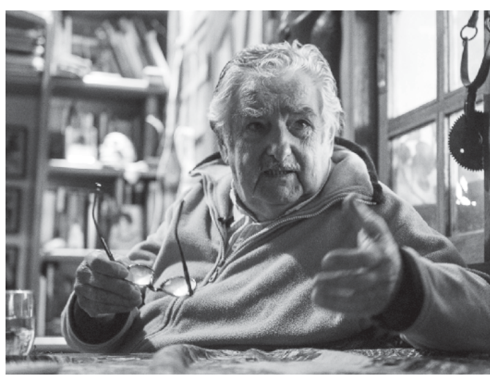
समलिङ्गी विवाहलाई वैधानिक बनाएर उरुग्वेलाई मनोरञ्जनात्मक गाँजाको प्रयोगलाई

सन् २०२४ मे महिनामा उनलाई अन्नप्रणालीको क्यान्सर भएको पत्ता लागेको थियो, जुन पछि उहाँको कलेजोमा फैलियो । उनकी श्रीमती लुसिया टोपोलान्स्कीका अनुसार यस हप्ता उहाँले पोलिप्टिभ हेरचाह प्राप्त गरिरहेका थिएँन । उनको निधनमा ल्याटिन अमेरिका र बाहिरका वामपन्थी नेताहरूबाट श्रद्धाञ्जलि व्यक्त भएका छन् । बोलिभियाका पूर्व राष्ट्रपति इभो मोरालेसले आफ्ना 'भाइ' मुजिकाको निधनबाट दुःखी भएको बताए । 'म सधैं अनुभव र बुद्धिले भरिएको उहाँको सल्लाह सम्झन्छु', उनले भने । ब्राजिलको सरकारले उनलाई 'हाम्रो समयका सबैभन्दा महत्वपूर्ण मानवतावादीहरू मध्ये एक' भनेर सम्मान गरेको छ भने स्पेनका प्रधानमन्त्री पेद्रो सान्चेजले मुजिकाले 'जुन कुरामा विश्वास गरे, अभियान चलाउनुभयो र बाँच्नुभयो' त्यो 'एक राम्रो संसार' थियो भने । आफ्नो छोटी शासनकालमा मुजिकाले गर्भपतन र