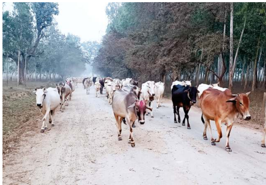
चरण क्षेत्रबाट गोठ फर्किदै गाईवस्तु: सर्लाहीको हरिपुर नगरपालिका-१, जानकीनगरस्थित वन चरण क्षेत्रबाट गोठतर्फ फर्किदै गरेका गाईवस्तु । पछिल्लो समय व्यावसायिक पशुपालनतर्फ किसानको आकर्षण बढ्दो छ ।