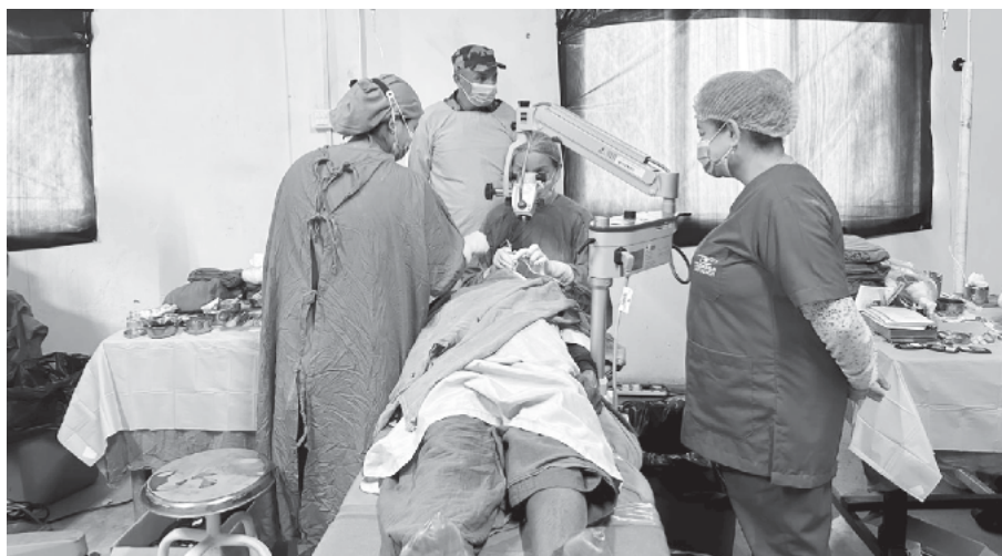
सहकार्य र नेपाली सेना विरदल गण गौरको

मधेशहट्टि चन्द्रपुर । नेपाली सेनाको सहयोगमा रौतहटका विपन्न तथा गरिब परिवारका पाँच सय ३१ जनाको निःशुल्क शल्यक्रिया गरिएको छ । गत पुस २८ गतेदेखि माघ २ गतेसम्म रौतहटको गुरुडा-५ शिवनगरमा आयोजित निःशुल्क आँखा शिविरमा पाँच सय ३१ जनाको आँखाको शल्यक्रिया गरिएको हो । नेपाल आँखा कार्यक्रम तिलगङ्गा आँखा प्रतिष्ठानको सहकार्य र नेपाली सेना विरदल गण गौरको