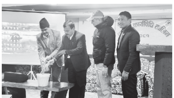
लिएको छ । अदालतमा मुद्दा दायर गर्दा हुने कमीकमजोरीका सम्बन्धमा प्रष्ट पार्ने उद्देश्यले तालिम आयोजना गरिएको जिल्ला डिभिजन वन कार्यालयका