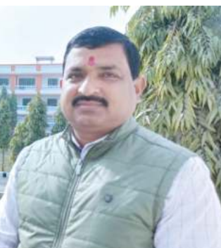
मूल्यांकन जनताले गरिरहेका छन्।