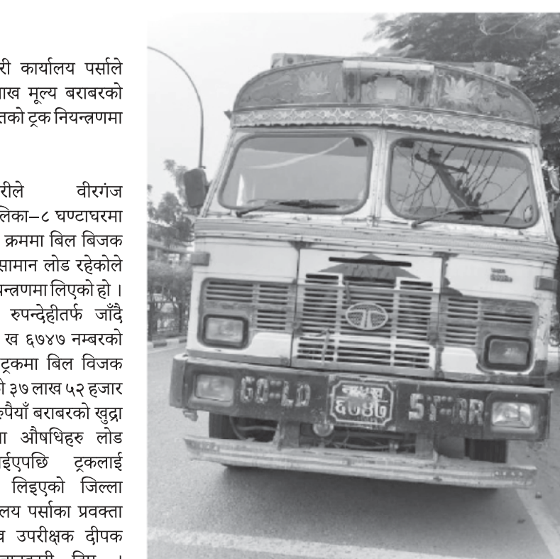
कारवाहीको लागि राजस्व बारामा बुझाइएको प्रहरीले अनुसन्धान कार्यालय पथलैया जनाएको छ ।