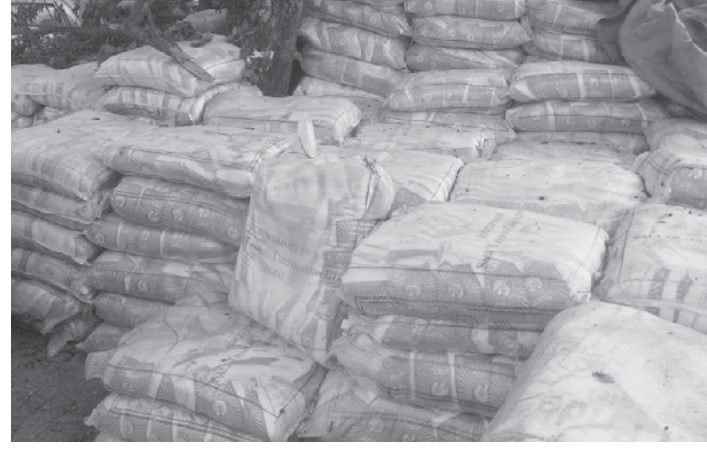
नुन बिक्री भएको हो । कार्यालयले गरी सहूलियत दरको सुपथ मूल्य दर्शाएकै तथै छठपर्वलाई लक्षित पसल सञ्चालन गरी नुन बिक्री गरेको

मधेशदृष्टि जनकपुरधाम । साल्ट ट्रेडिङ कर्पोरेशन लिमिटेड शाखा कार्यालय धनुषाले गत आर्थिक वर्ष २०८०/८१ मा १८ करोड ६२ लाख ८१ हजार मूल्यबराबरको आयोडिनयुक्त नुन बिक्री गरेको छ । धनुषा, महोत्तरी तथा सिन्धुली कार्यक्षेत्र रहेको सो कार्यालयले उक्त तीनवटा जिल्लामा आफ्ना २५ डिलरमार्फत आयोडिनयुक्त नुन बिक्री गरेको हो । कार्यालयका अनुसार चालु आर्थिक वर्षको तीन महिना अर्थात् साउन, भदौ र असोजमा पाँच करोड २३ लाख मूल्यबराबरको नुन बिक्री गरेको छ । सो अवधिमा ४५ हजार तीन सय ७० बोरा