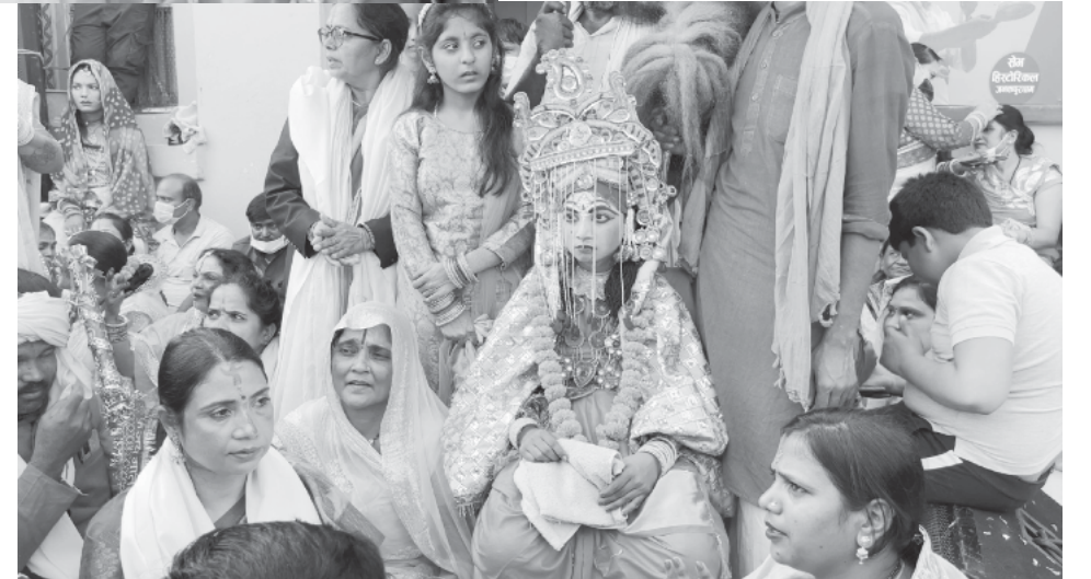
शिव-पार्वतीको विषयवस्तुमा प्रचुर मात्रामा पाइन्छ ।

मनोरञ्जनको साधनहरू रहेका छन् । अहिलेपनि मिथिलामा नाटक क्षेत्र सबै भन्दा बढि समृद्ध मानिएका छन् । कृति रत्नाकरमा रंगमञ्चबाट उत्पन्न संस्कारहरूबारे विस्तृत रूपमा चर्चा गरिएको छ, जुन कुनै प्राचीन ग्रन्थबाट उद्धृत नभएर मिथिलाको परम्परागत संस्कृतिमा गाँसिएका थिए, जसलाई चण्डेश्वरले मात्र नियमन गरेका छन् । भारतीय कविताका महान् गुरु भरत मुनिले विश्वको काव्य साहित्यमा उत्कृष्ट चिन्तन मानिने सोही अवधिमा नाट्यशास्त्रको समग्र रूपरेखा प्रस्तुत गर्नुभएको थियो । महाकवि काली दासको नाट्य कृतिलाई विश्वकै उत्कृष्ट नाट्य साहित्य मानिन्छ । त्यसबेला नाट्य कलाको योगदानमा मिथिला पनि पछि परेको थिएन । आध्यात्म चिन्तन यहाँको समाजमा विशेष थियो