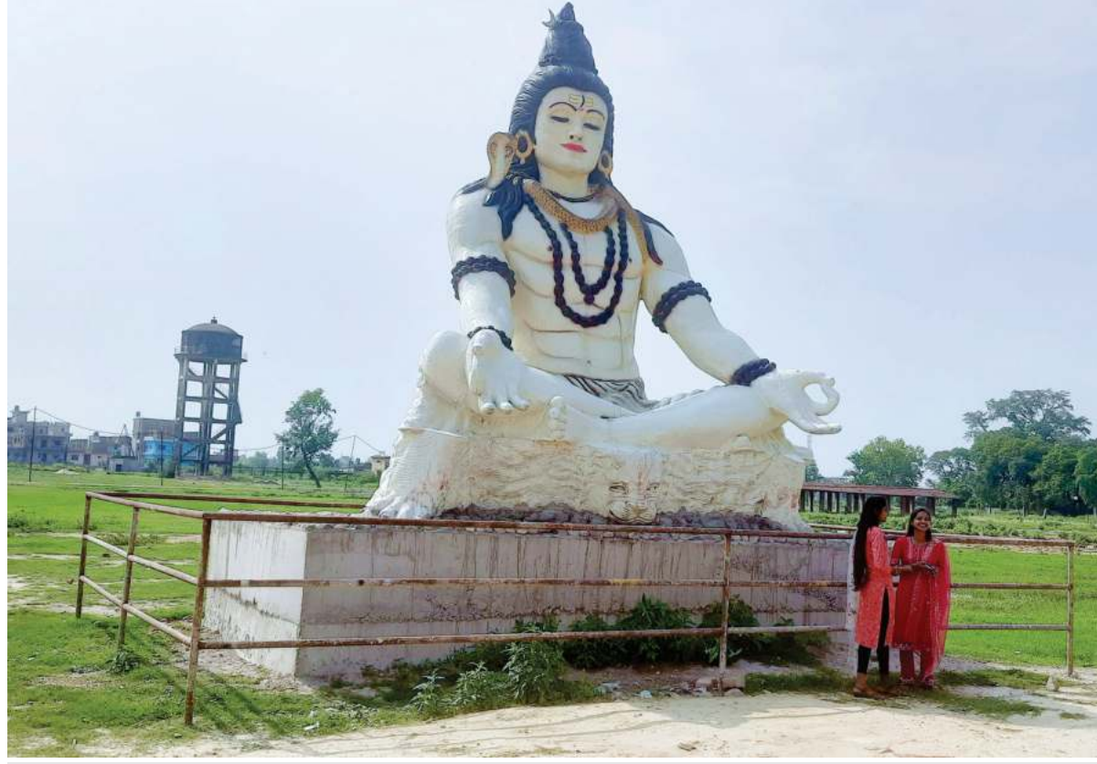
शिवमूर्ति: वीरगंज महानगरपालिका-१४, पिपरास्थित शिवको मूर्तिमा ।