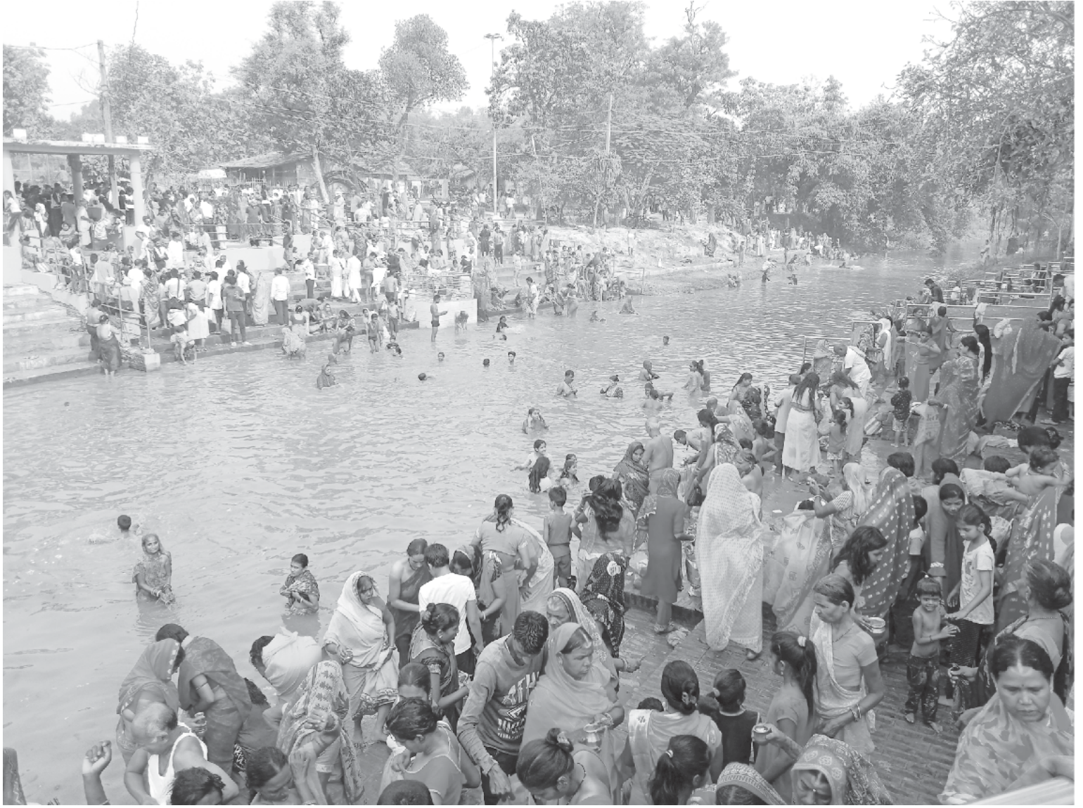
जनकपुरमा शाही स्नान : जानकी नवमी उत्सवको अवसरमा शुक्रबार जनकपुरको दुधमती नदीमा शाही स्नान गर्दै भक्तजन ।