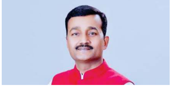
यादवको स्वागत गरिन लागिएको हो । जसपा नेपाल विभाजनपछि यादव संघीय सरकारका स्वास्थ्य तथा जनसंख्यामन्त्री बनेका हुन् ।

मधेशहट्टि वीरगंज । नवनियुक्त स्वास्थ्य तथा जनसंख्यामन्त्री प्रदीप यादवलाई वीरगंजमा भव्य स्वागत गरिने भएको छ । पर्साका चिकित्सक तथा स्वास्थ्यकर्मीले आफ्नो जिल्लाका संसद स्वास्थ्यमन्त्री भएकामा खुशी हुँदै बधाइ ज्ञापन कार्यक्रम आयोजना गरेका हुन् । शनिबार बिहान ९ बजे क्लासिक बैक्रेटमा कार्यक्रम गरेर स्वास्थ्यमन्त्री