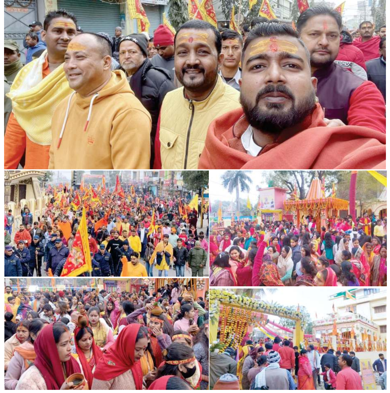
रामजानकी मन्दिरमा प्राणप्रतिष्ठाः भारत, अयोध्यामा नवनिर्मित श्रीराममन्दिरको प्राण प्रतिष्ठाको मुहुर्त पारेर वीरगंजमा पनि दशकौंदेखि भूमाफियाले कब्जा गरेको घडिअर्वा पोखरी परिसर नजिकै रहेको रामजानकी मन्दिरमा प्राणप्रतिष्ठा गरिएको छ ।