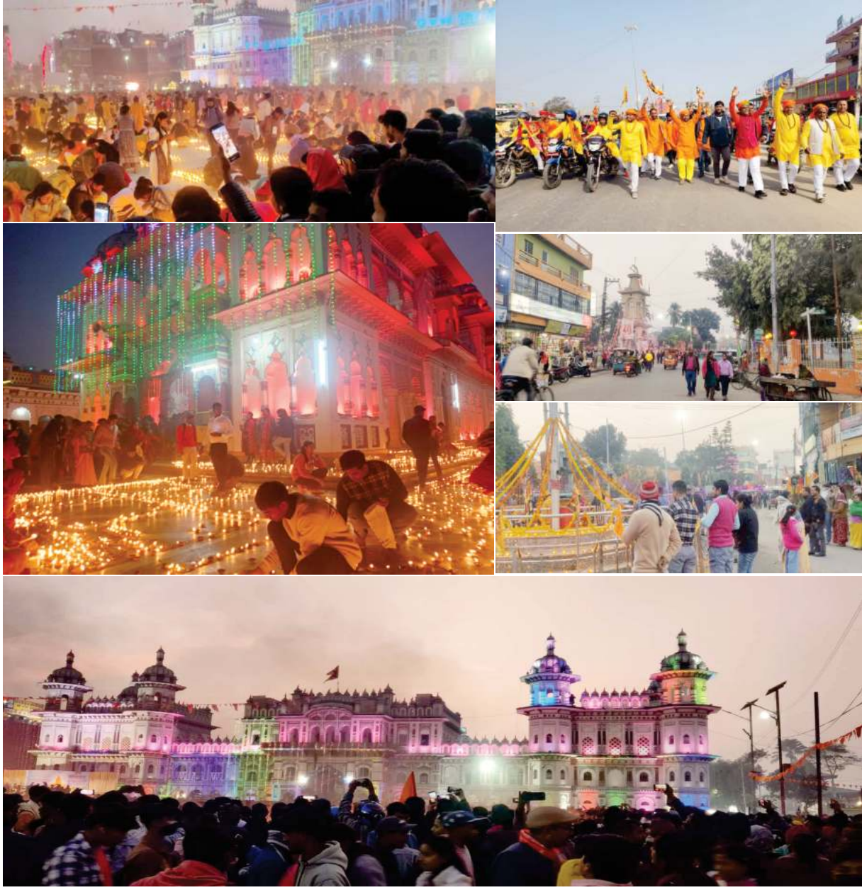
सवालाख दीप प्रज्वलनः भारत, अयोध्यास्थित राम मन्दिरमा प्राणप्रतिष्ठाका अवसरमा जनकपुरधामस्थित जानकी मन्दिरमा सवा लाख दीप प्रज्वलन ।