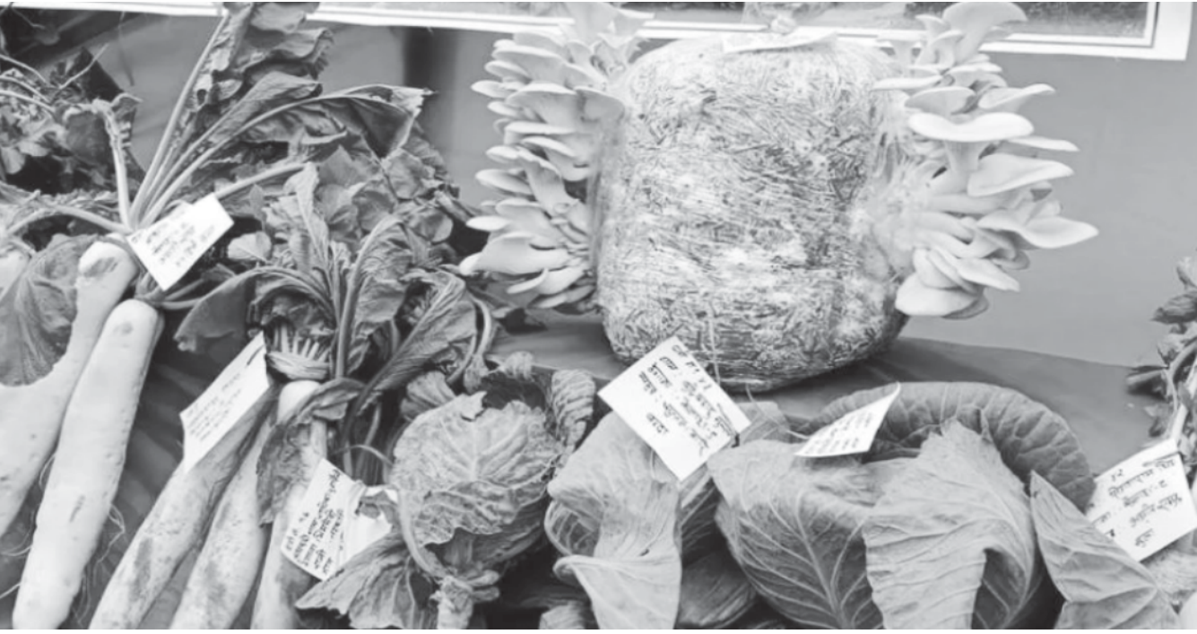
गण्डकी प्रदेश सरकारका मुख्यमन्त्री सुरेन्द्रराज पाण्डेले गाउँमा रोजगारीको अवसर सृजना गर्न