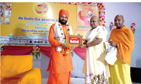
सनातनलाई डेंगु र मलेरियासँग तुलना गरेका थिए, महाराजले