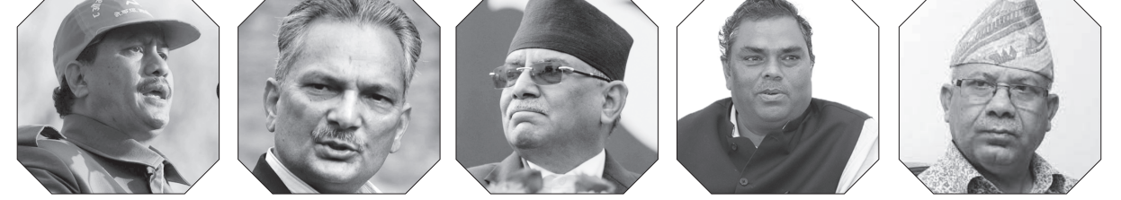
सार्वजनिक गरिने बताइएको छ। मोर्चामा डा बाबुराम भट्टाई, नेतृत्वको समाजवादी पार्टी नेपालसमेत सहभागी हुने बताइएको छ। यसअघि नै प्रधानमन्त्री पुष्पकमल दाहाल 'प्रचण्ड' र अध्यक्ष भट्टाईबीचको भेटवार्तामा सो सहमति भइसकेको छ।