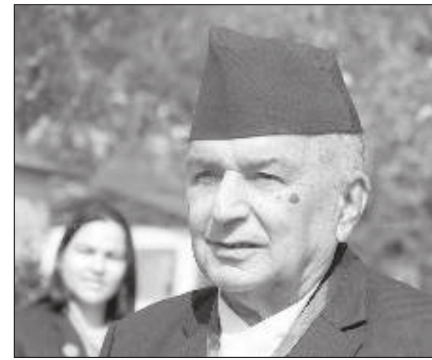
उपचारका लागि के गर्ने भन्ने डाक्टरहरूसँग परामर्श गरेको छ ।