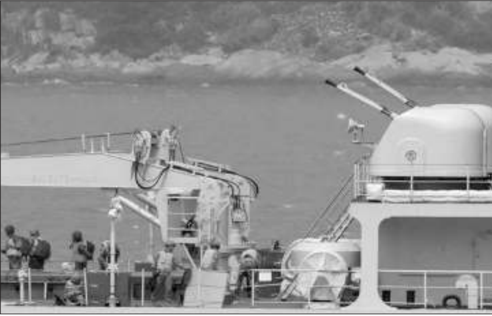
चीनको गतिविधि नजिकबाट निगरानी गरिरहेको र त्यस क्षेत्रमा स्थिरता कायम गर्न आवश्यक स्रोतसाधन अमेरिकासँग रहेको बताए । संयुक्त राज्य अमेरिकाले सन् १९७९ मा बेइजिङको पक्षमा उभिएँ ताइपेइसँग कूटनीतिक सम्बन्ध तोडेको थियो तर कानुनी आधारमा ताइवानलाई आत्मरक्षाका लागि सहयोग गर्न अमेरिका बाध्य छ । बेइजिङले ताइवानलाई चीनको एउटा टुकिएको प्रान्तको रूपमा हेर्छ । र उसले घोषित रूपमा नै आवश्यक परे सैन्य बल प्रयोग गरेर भएपनि ताइवानलाई पुन आफूमा गाभ्ने बताउने गरेको छ । ताइवान राष्ट्रपति साई इङ-वेन अमेरिकाको भ्रमणबाट फर्केको केही घण्टापछि चीनले त्यो अभ्यास सुरु गरेको थियो । ताइवानको रक्षा मन्त्रालयले ४५ वटा चिनियाँ सैन्य विमान र ९ वटा सैन्य पानीजहाजले ताइवान स्ट्रेटको मध्यरेखा पार गरेको वा

काठमाडौं । ताइवान राष्ट्रपति त्साइ इङ-वनले अधिल्लो साता गरेको संयुक्त राज्य अमेरिका भ्रमणपछि उत्पन्न तनावका माफ चीनले दोस्रो दिनपनि ताइवान वरपर सैनिक अभ्यास जारी राखेको छ । बेइजिङले यो अभ्यासलाई ताइपेइविरुद्धको 'कडा चेतावनी'का रूपमा व्याख्या गरेको छ । उसको जलसेना र हवाई सेनाले त्यस टापुलाई घेराबन्दी गर्ने पूर्व तयारीको सैन्य अभ्यास जारी राखेका हुन् । ताइवानको रक्षा मन्त्रालयले पछिल्लो २४ घण्टाभित्र ७१ वटा चिनियाँ जेट विमान र ९ वटा नौ सैनिक पानी जहाज उक्त टापु वरपर देखिएको जनाएको छ । चिनियाँ अभ्यासलाई लिएर ताइवानले आक्रोश व्यक्त गरेको छ ।