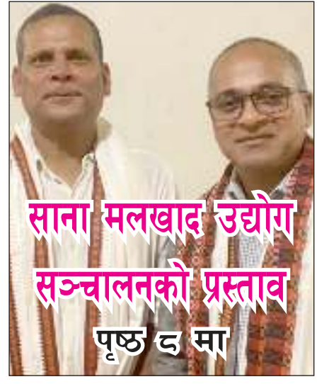
साना मलखाद उद्योग सञ्चालनको प्रस्ताव पृष्ठ ६ मा

● वर्ष १ ● अंक १३० ● २०७९ साल चैत ८ गते बुधवार ● Wednesday 22, Mar. 2023 ● पृष्ठ ८ ● मूल्य रु. ५/-