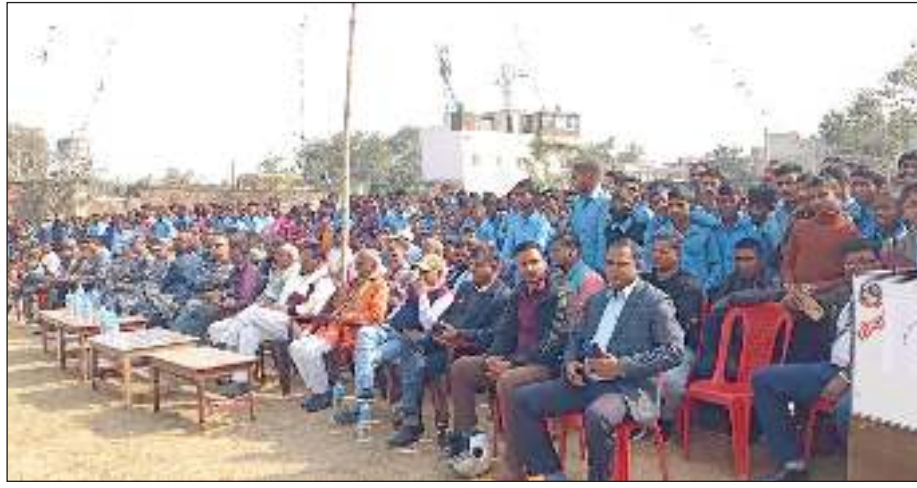
आगलागीको घटना न्यूनिकरण गर्न तथा आगलागी भई हाले पनि त्यसको उद्धारका लागि

मधेशदृष्टि वीरगंज ३ फागुन । सशस्त्र प्रहरी बल नम्बर १३ हेड क्वार्टर पर्साको आयोजनामा बुधवार पोखरीयामा आगलागीबाट हुने क्षतिको न्यूनिकरण तथा उद्धार सम्बन्धी नमूना प्रदर्शन सम्पन्न भएको छ । पोखरीया नगरपालिकाको संयोजनमा आयोजित कार्यक्रममा गमीयाम शुरु भएसँगै विशेष गरी ग्रामिण क्षेत्रमा सामान्य लापरवाहीकोकारण आगलागीबाट ठूलो धनजनको क्षति हुने गरेको प्रति सचेतना जगाउन र