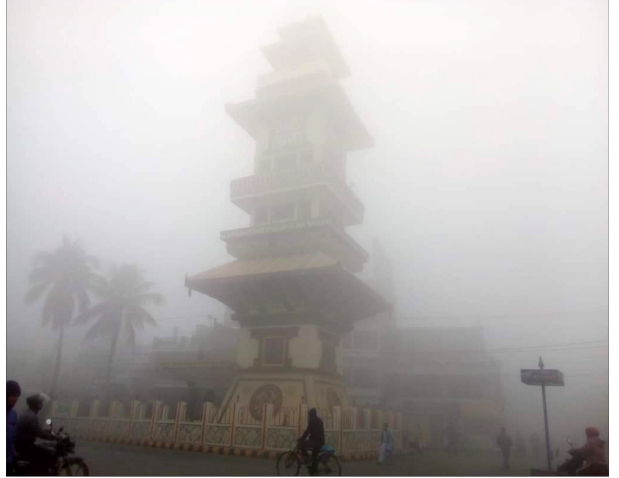
अचानक बढेको शितलहरीका कारण मधेशको जनजिवन अस्तव्यस्त